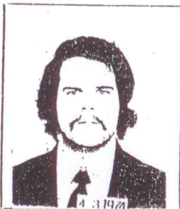
Foto 1974 Polegar Direito